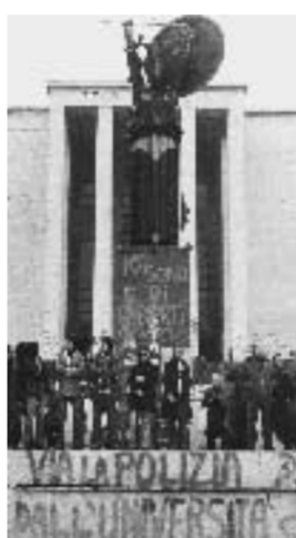
Disordini. Studenti a Roma nel 1977