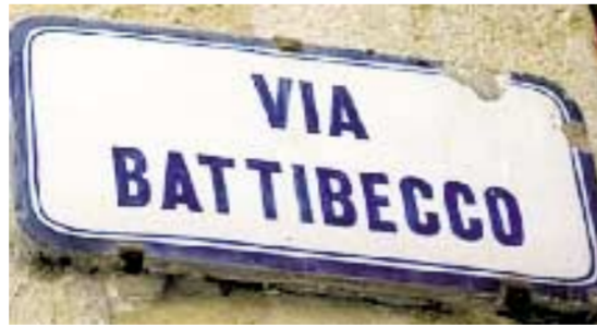
Strada insolita. Una targa di Bologna